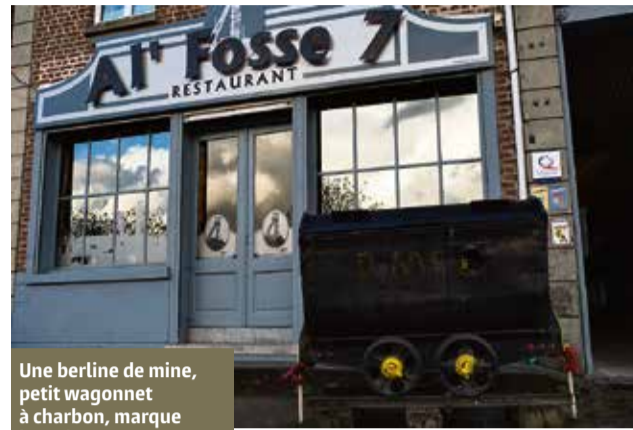
Une berline de mine, petit wagonnet à charbon, marque l'emplacement de Al' fosse 7, restaurant à l'ambiance minière.

Il ne sera pas possible de se garer dans Lens les jours de matches. Des navettes seront mises en place entre des parkings à l'extérieur de la ville et le centre.