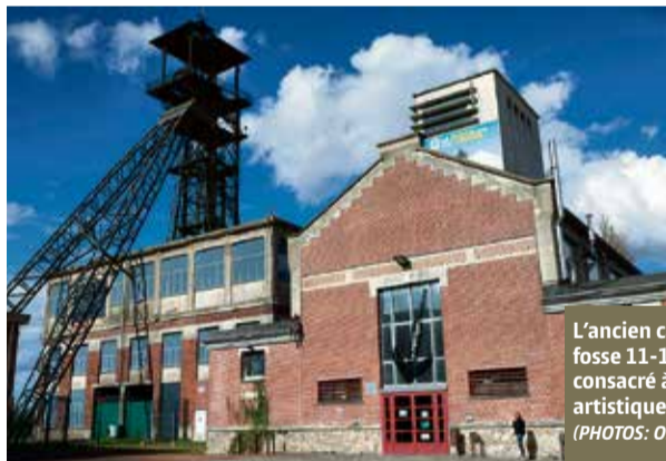
L'ancien carreau de fosse 11-19, désormais consacré à la création artistique.