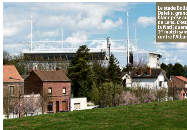
Le stade Bollaert-Delelis, grand vaisseau blanc posé au cœur de Lens. C'est ici que la Nati jouera son 1 er match samedi 11 juin contre l'Albanie.