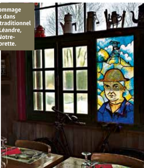
Vitrail en hommage aux mineurs dans l'estaminet traditionnel Al' potée d'Leandre, au pied de Notre-Dame-de-Lorette.