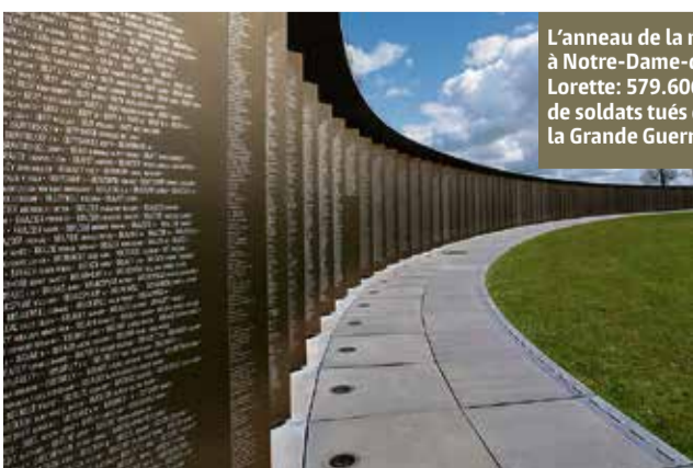
L'anneau de la mémoire à Notre-Dame-de-Lorette: 579.606 noms de soldats tués durant la Grande Guerre.