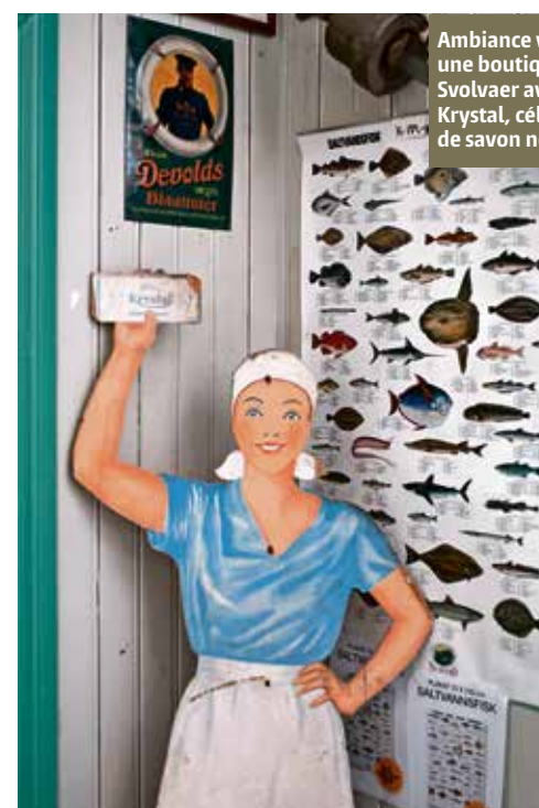
Ambiance vintage dans une boutique de Svolvær avec cette pub Krystal, célèbre marque de savon norvégienne.

«Aux abords du Maelström, les courants contraires y croisent de fortes marées. Comme le fond remonte le long des côtes, la mer perd tout sens logique»