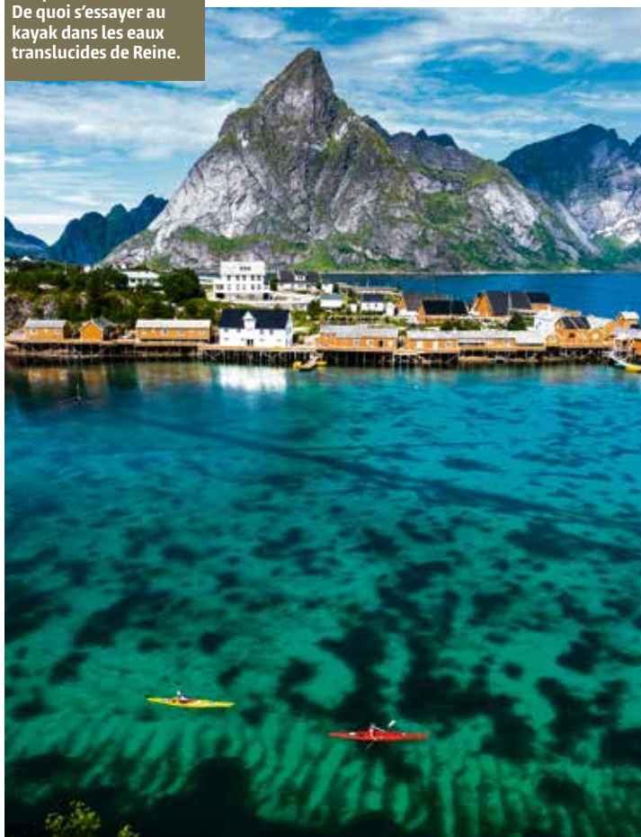
Le Gulf Stream protège l'archipel des températures extrêmes. De quoi s'essayer au kayak dans les eaux translucides de Reine.

Anker Brygge, sur le port de Svolvær. Le visage rougi, les mains craquelées, ces descendants de Vikings s'attablent devant une bière estampillée d'un drakkar, toujours prompts à conter une histoire salée. Que l'on débarque par avion ou par bateau, c'est souvent à Svolvær que le voyage commence. D'ici, quelques heures de route suffisent pour rejoindre Å, à l'autre extrémité de l'archipel. Les quatre îles principales (Austvågøy, Vestvågøy, Flakstad et Moskenes) sont reliées par des tunnels ou des ponts. Entre deux escarpements se nichent des baies, des criques, des plages et des hameaux figés dans le temps. Plus on descend vers le sud, plus le relief devient escarpé et la nature grandiose. Mieux vaut prévoir plusieurs jours pour accomplir ces quelque 200 kilomètres.