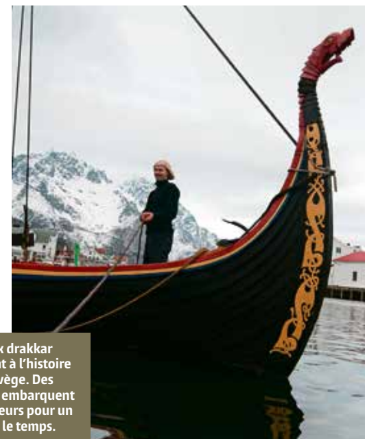
Le fameux drakkar appartient à l'histoire de la Norvège. Des répliques embarquent les voyageurs pour un saut dans le temps.

Le site de l'Office du tourisme qui propose une foule d'adresses et de bons plans. www.visitnorway.com