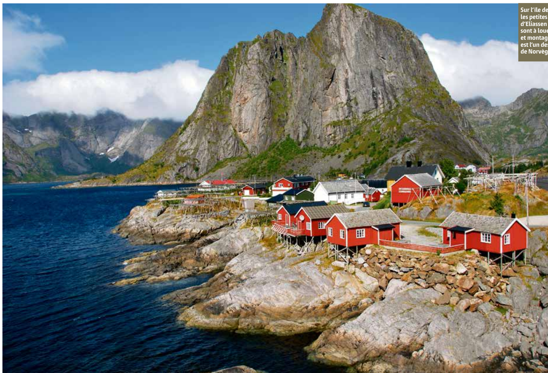
Sur l'île de Hamnøy, les petites maisons d'Eliassen Rorbuer sont à louer. Entre mer et montagne, le village est l'un des plus beaux de Norvège.